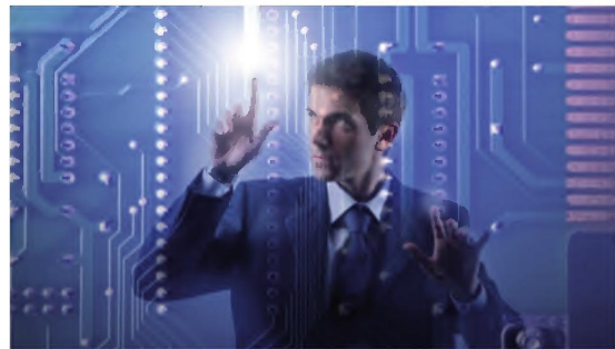
Trouver des ingénieurs compétents ? Hitechpros, qui fédère les trois quarts des acteurs français du secteur informatique, en a fait sa rentable spécialité

Outre la bonne tenue du titre, l'actionnaire peut compter sur une politique de distribution particulièrement généreuse. Le dernier dividende distribué (1 €) procure ainsi, indique Le Journal des finances , un rendement très appréciable de 13,3 %. La générosité de la société à l'égard de ses actionnaires s'explique par la pertinence de son modèle économique. Cette start-up, fondée il y a une dizaine d'années, est placée sur un créneau novateur et porteur, tel un site de rencontres. Hitechpros favorise la mise en contact des différents intervenants du marché des services informatiques : consultants indépendants, éditeurs de logiciels, SSII et directions spécialisées des grandes entreprises. L'offre de l'entreprise s'articule autour de deux pôles : la branche Hitechpros Staffing, qui permet aux grandes directions informatiques de trouver les sociétés compétentes et les ingénieurs disponibles pour un projet déterminé, et le site Internet Hitechpros.com, qui permet aux entreprises abonnées de traiter directement entre elles, via un système d'annonces très spécialisées.